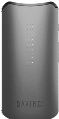
IQC zobrazené v

Počáteční teplota 350°F / 176°C Koncová teplota 370°F / 188°C