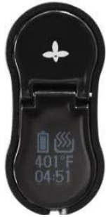
Bylinná komora Ory