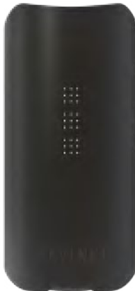
IQ2 zobrazený v Smart Path 3

Počiatočná teplota 350°F / 176°C Koncová teplota 370°F / 188°C